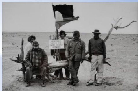
聖地を守れ（オーストラリア） 豊崎博光