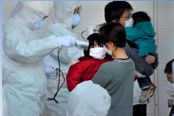
測りきれない将来への不安（福島） 森住卓

広島、長崎の原爆、核実験、原発、ウラン鉱山などは世界に無数のヒバクシャを生み出し、福島で再び悲劇は繰り返されました。こうした世界各地のヒバクシャを撮り続けてきた六人の日本人写真家の写真による世界ヒバクシャ展は、ブラジルの国際会議や、台湾、韓国など、海外でも大きな反響を呼んできました。戦後70周年の今年、広島、長崎、そして世界のヒバクシャの思いをぜひ感じてください。世界百力国での写真展開催に向けて、ご支援・ご協力の輪が広がることを願っております。